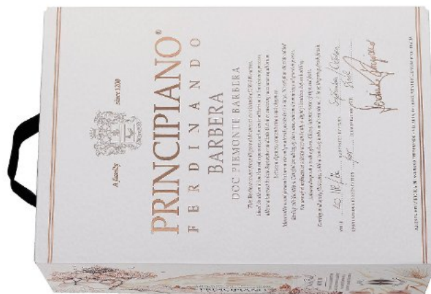
Terningkast 5: 723106 Principiano Piemonte Barbera 2013, 12 prosent vol, Ferdinando Principiano, Piemonte/Italia, 300 cl, 389,90 kroner. Bestillingsutvalg (men flere lokale utsalg har den inne). Dyp rød. Kirsebær, skogsbær og krydderurter. Mørk bærfrukt, organisk preg med jordbunn og blomster i duft. Bra balansert vin med middels fylde og vel så god som i 2012-utgaven. Til pasta, pizza og lettere kjøttretter.